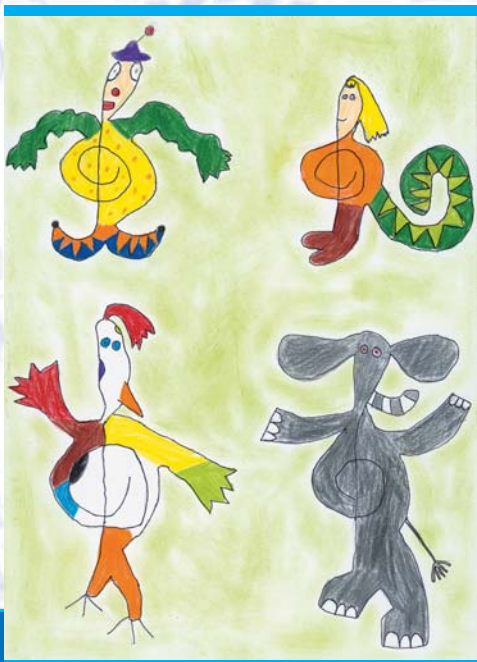
Lilia Kolonko – Notenschlüsselfiguren